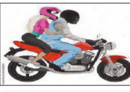
दो वर्षों में दुर्घटना की स्थिति

ट्रैफिक व्यवस्था चरमराने के कारण वाहन चालकों का बेखौफ होकर वाहन ड्राइविंग लाइसेंस के भी पूरी रफ्तार से बीच शहर में मोडिफाइड साइलेंसर लगा वाहन चलाने लगे हैं। इसी तरह शराब पीकर भी वाहन चालक बेखौफ होकर शहर में अपनी गाड़ियां चलाने नजर आते हैं। जो आम लोगों के लिए खतरा बन सकता है।