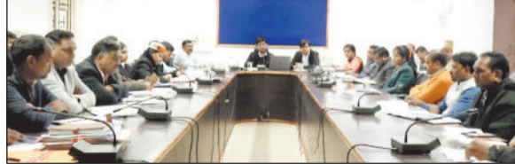
अधिकारियों की बैठक लेते कलेक्टर।

कलेक्टर ने कलेक्ट्रेट सभाकक्ष में समय-सीमा की बैठक ली। उन्होंने विशेष पिछड़ी जनजाति पहाड़ी कोरवा, बिरहोर क्षेत्र में चलाए जा रहे पीएम जनमन योजना के सर्वे संबंध में जानकारी ली। प्रधानमंत्री जनमन योजना के प्रभावी एवं समयबद्ध क्रियान्वयन हेतु विशेष पिछड़ी जनजाति वर्ग के परिवारों को शत-प्रतिशत योजनाओं का लाभ देने विभागीय अधिकारियों को निर्देश दिए तथा नियमित मॉनिटरिंग करने कहा।