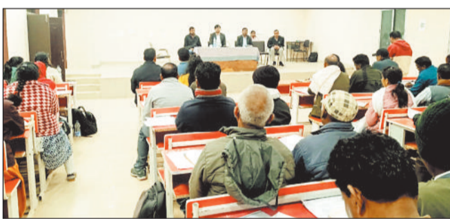
पंचायत सचिवों की बैठक लेते सीईओ।

जिला पंचायत सीईओ ने मनोरा और जशपुर के पंचायत सचिवों एवं तकनीकी सहायकों की ली बैठक