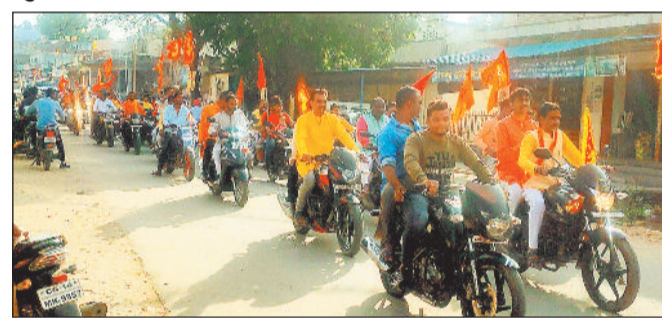
युवाओं ने निकाली बाइक रैली।

कांसाबेल। अयोध्या धाम में हुए राम मंदिर प्राण प्रतिष्ठा समारोह का आयोजन के परिपेक्ष में कांसाबेल में सुबह नगर के युवाओं द्वारा बाइक रैली निकाल कर शहर का भ्रमण किया गया एवं पूरा शहर युवाओं के जयश्रीराम के नारों से गुंजाता रहा बाइक रैली शहर का भ्रमण करते हुए वापस मंदिर पहुंचकर सुंदरकांड का पाठ करना शुरू किया। सुंदरकांड के पश्चात महाआरती का आयोजन हुआ जिसमें पथलगांव विधायक ने शिरकात किया तत्पश्चात अमरकंटक से आए हुए कौतिल मंडली का कार्यक्रम संस्था कालीन शुरू किया गया। भजन मंडली के कौतिल भजन का कार्यक्रम का शुभारंभ किया एवं अमरकंटक के भजन मंडली द्वारा किए जा रहे भजन कौतिल का आनंद उठाए पूरे कार्यक्रम में शहर के युवा वृद्ध व महिलाओं ने बढ़वढ़ कर हिस्सा लेते हुए पूरे शहर को राममय बना दिया।