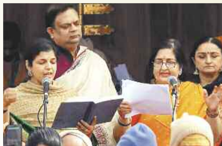
अनुराधा पौडवाल ने भजन प्रस्तुत किया।

राम मंदिर प्राण प्रतिष्ठा के बाद कंगना ने भी अपने आधिकारिक एक्स हैडल पर एक वीडियो साझा किया है। इसके कैप्शन में उन्होंने लिखा, 'राम आ गए हैं।' वीडियो में कंगना जोर-जोर से 'जय श्री राम' के नारे लगाते हुए नजर आईं। इससे पहले कंगना ने अपनी कुछ तस्वीरें साझा कर राम मंदिर प्राण प्रतिष्ठा समारोह की झलक दिखाई थीं।